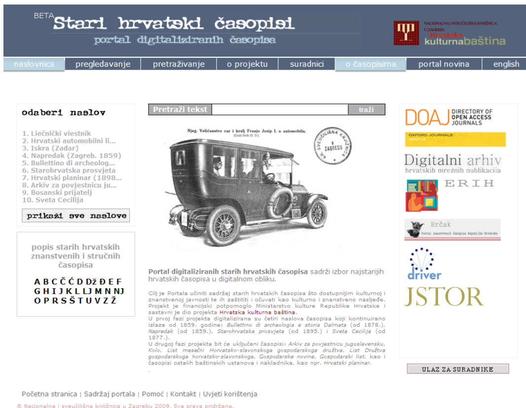
Fig. 2: Portal de periódicos históricos croatas

A la labor de crear el portal se le dio forma usando las tendencias mundiales, las mejores prácticas y las soluciones usadas en todo el mundo en el campo de la digitalización y la preservación de patrimonio cultural en otros países 5 . El Portal respeta las recomendaciones y las normas estipuladas en el proyecto nacional para la digitalización de existencias de archivos, de bibliotecas y de museos del Patrimonio cultural croata 6 .