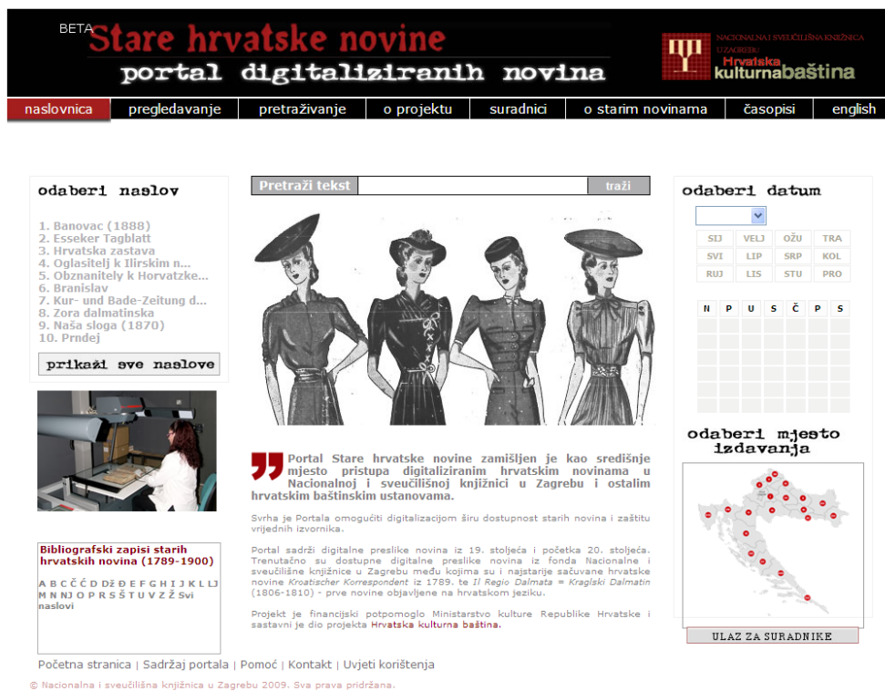
Fig.1: Portal de periódicos históricos croatas

La creación del Portal de revistas y periódicos históricos croatas del siglo XIX (al que más adelante se le dirá ‘el Portal’) es el resultado del análisis de esta situación. Se ganó más impulso gracias a las Conclusiones de la Mesa Redonda: El Estado de las Colecciones de Periódicos en las Bibliotecas Croatas, en la Asamblea N° 35 de la Asociación de Bibliotecas Croatas (Plitvice, septiembre de 2006), donde salió a relucir la necesidad urgente de proteger los periódicos del siglo XIX 4 . Los objetivos más básicos por los cuales se creó el Portal fueron: idear una solución integrada para evitar que el patrimonio cultural siga deteriorándose, dar lugar a la preservación a largo plazo y habilitar el acceso de colecciones antiguas de la Biblioteca y otras instituciones patrimoniales, mediante un sistema cooperativo para el ingreso y la administración de datos. El nombre, el Portal de revistas y periódicos históricos croatas del siglo XIX, se refiere tanto al sistema de fondo como al exterior: la interfaz visible del sistema.