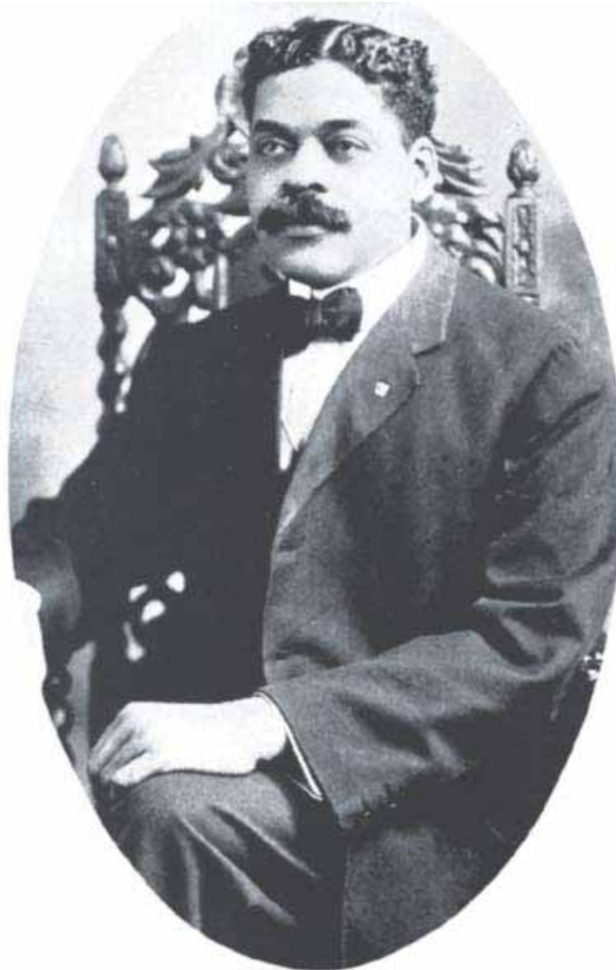
Arturo Alfonso Schomburg