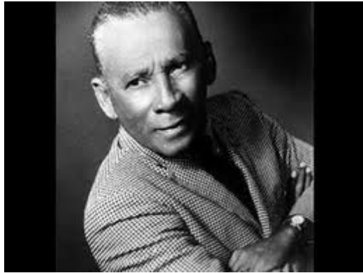
Rafael Hernández (El Jibarito)

Nació en Aguadilla Puerto Rico en 1891 y murió en 1965. Participó en la primera Guerra Mundial y luego se estableció en Harlem, Nueva York. Durante la Guerra fue músico en la banda militar "Harlem Hellfighters" compuesta exclusivamente por negros. Fue compositor y músico y es considerado como uno de los más importantes personajes de la música latinoamericana de todos los tiempos. En 1929 compuso la canción titulada "Lamento Borincano en un restaurant en Harlem, Nueva York", en la cual retrata la miseria y desesperanza del pueblo puertorriqueño.