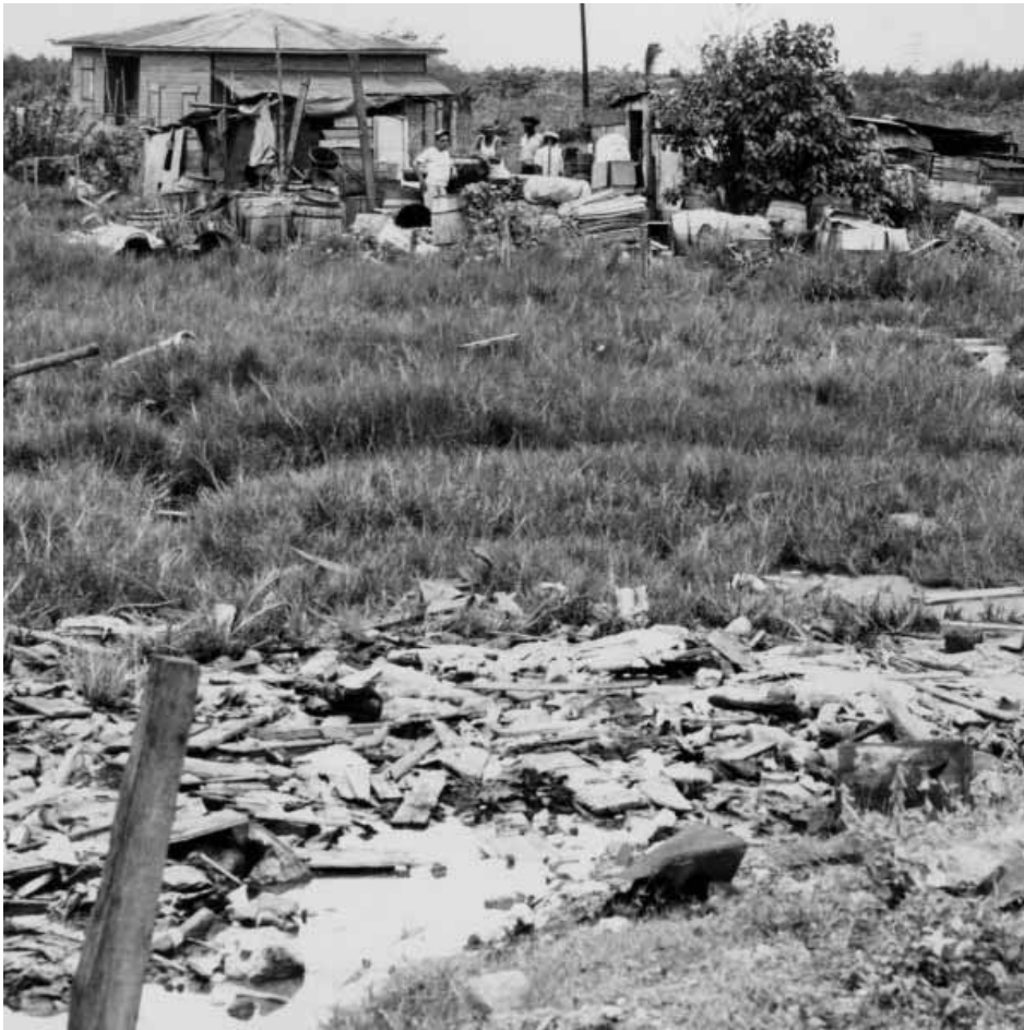
Foto 3: [Casucha en terrenos cerca al Puente de la Constitución] El Mundo, 19/agosto/1953. Pie de la foto: Hogares improvisados. Casuchas surgen cerca Puente de la Constitución. Varias vistas De las casuchas que aún quedan