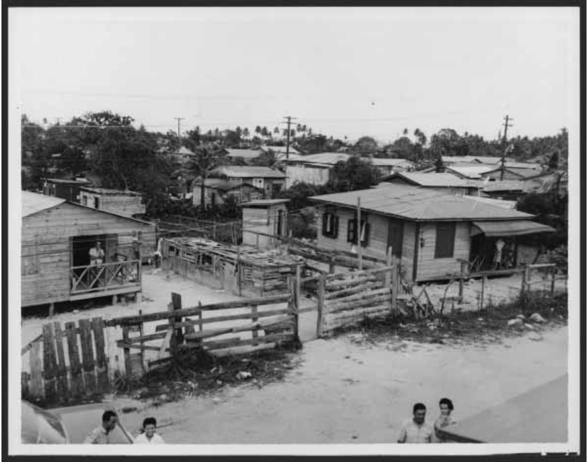
Foto 4: [Area residencial de la barriada Juana Matos en Cataño] Terrenos pantanosos acondicionados para viviendas El Mundo, 12 de marzo de 1960,p.22