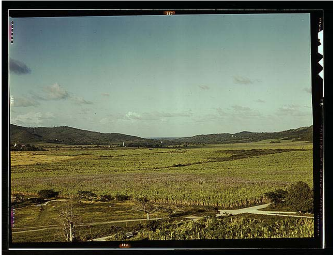
Foto1: Campo de Caña en Yabucoa (1951)