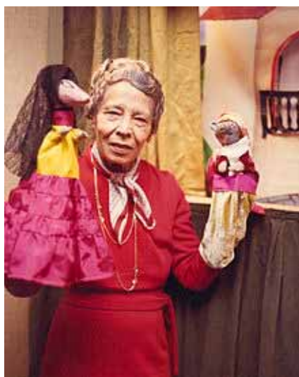
Pura Belpré Bibliotecaria, cuentista de literatura infantil y titiritera

Su carrera empezó en 1921 hasta su muerte en 1982. Nació en Cidra Puerto Rico, se educó en Puerto Rico, y en su obra capturó el encanto y espíritu de los cuentos populares y del folklore puertorriqueño. En 1930 emigró a Nueva York y fue la primera bibliotecaria hispana de la New York Public Library.