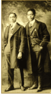
Jesús Colón, a la derecha Emigrante agrícola a Nueva York en 1917. Se convierte en líder comunitario y sindical importante.

Jesús Colón es otro pionero que emigró de Puerto Rico a la Ciudad de Nueva York en 1917 y se convirtió en un importante líder comunitario y sindical en la Ciudad de Nueva York. En el libro ( Puerto Rican Diáspora: Historical perspectives (2005) se citan obras de Jesús Colón que muestran el contraste de los sueños y aspiraciones por un lado y el desencanto con los Estados Unidos por el otro. Jesús Colón dice que en 1915, cuando estaba en Puerto Rico hojeando un libro de historia, vio la frase “we the people of the United States...” “That phrase evoked a picture of all those people who picked cotton in the South, raised wheat in the Dakotas, grapes in California...The people in Brooklyn who built the ships that plied the waters of the Caribbean. All those people and my father and the poor Puerto Rican sugar workers and tobacco workers, we were all together, the people of the United States. We all belonged.” (P.79). Pero para el 1948 Colón había reajustado sus sueños y aspiraciones de la siguiente manera: “In the phrase, we, the people of the United States that I admired so much were there first and second- class citizens? [In NYC] the worker told me that we [Puerto Ricans] were from a colony. [It is] sort of a storage house for cheap labor and a market for second class- industrial goods. Colonialism with its agricultural slavery, monoculture absenteeism, and rank human exploitation are making young Puerto Ricans today [1948] come in floods to the U.S. (p.80)